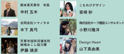
熊本県天草市 市長 中村 五木